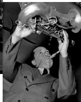
レスター・ヤング