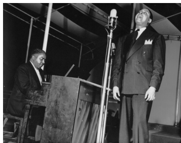
ピート・ジョンソン&ビッグ・ジョー・ターナー