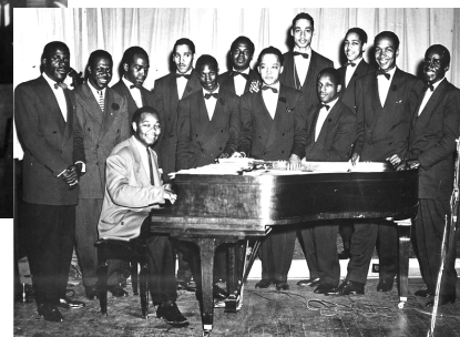
ジェイ・マクシャン楽団

- Perfect Complete Collection Vol.11 (Sound Hills)