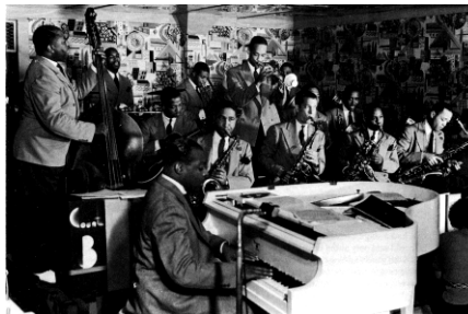
カウント・ベイシー楽団