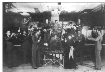
アンディ・カーク&ヒズ・クラウド・オブ・ジョイ