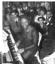
メアリー・ルー・ウィリアムス