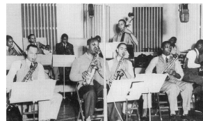
ハーラン・レオナード&ヒズ・ロケッツ