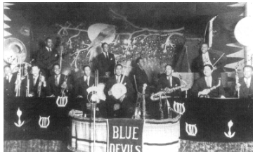
オクラホマ・ブルー・デヴィルズ