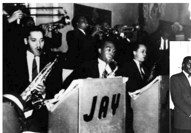
ジェイ・マクシャン楽団 with チャーリー・パーカー

- Charlie Parker 'Now's the Time' (Verve)